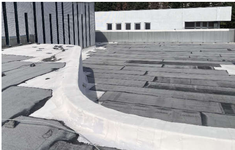
- prvky střechy